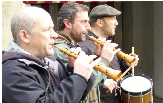
Pasacalles de dulzaineros en las calles de Oiartzun. HMT CON EL BONO HASTA SOINUENEA

Los San Estebanes de Oiartzun se celebraron entre los días 2 y 6 de agosto. Fueron una ocasión perfecta para coger los instrumentos y animar el ambiente. Entre otros, se pudieron oír las dulzainas que cada vez son más comunes en las calles de Oiartzun. El 4 de agosto se celebró el Encuentro de Gigantes de Euskal Herria donde también había dulzaineros de diferentes comarcas acompañando a los gigantes, el día siguiente alegraron la plaza tocando en el grupo Hernaniko Soinua, pero su presencia fue especialmente destacada el 6 de agosto. Por la mañana acompañaron a quienes acudieron a la llamada de la coral Lartaun a cantar por las calles tocando en los momentos de descanso de los cantantes y, por la tarde, por la tarde se celebró el 6º Encuentro de Dulzaineros de Oarsoaldea y Donostialdea.