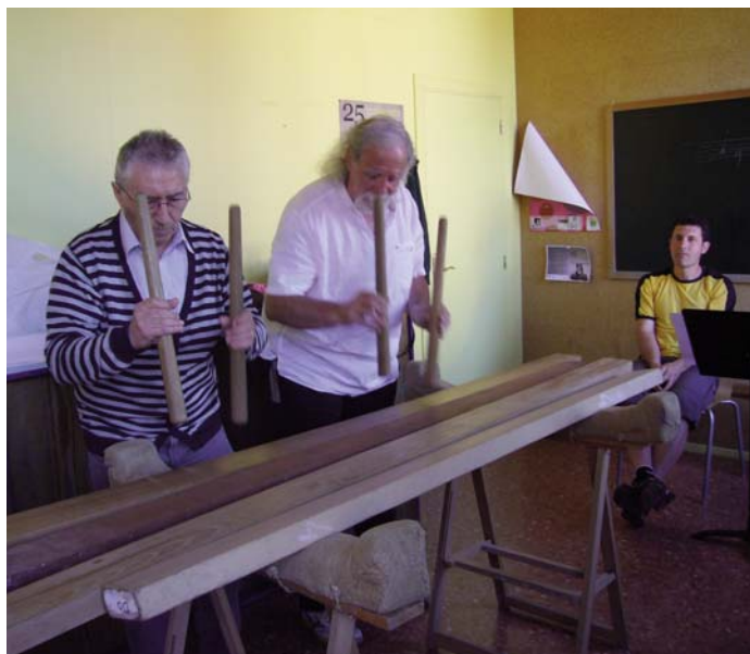
Las clases se dan en el frontón Madalensoro, entre ellas las de txalaparta. HMT

Que la fuerza acompañe tanto al principio como al final del curso a todos los que elijan hacer este camino.