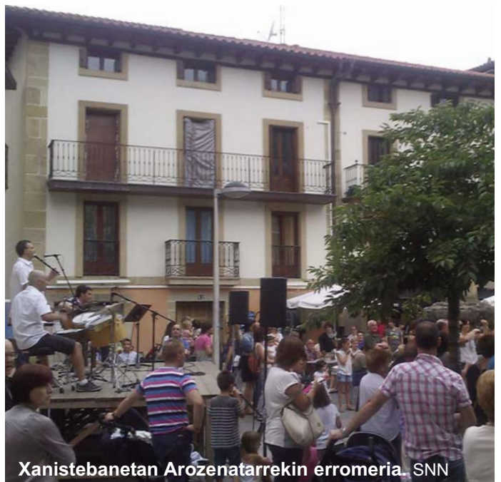
Xanistebanetan Arozenatarrekin erronomia. SNN

Entre los diferentes actos organizados, destacaríamos los conciertos que organizamos, uno en cada estación del año. Teniendo en cuenta que la duración de los conciertos y las características de los conciertos están dirigidos más a los adultos, el mismo día que el concierto, pero por la mañana, hace un año empezamos a ofrecer conciertos didácticos para los niños y su entorno. Viendo la buena acogida de estos, este año hemos seguido adelante con el proyecto.