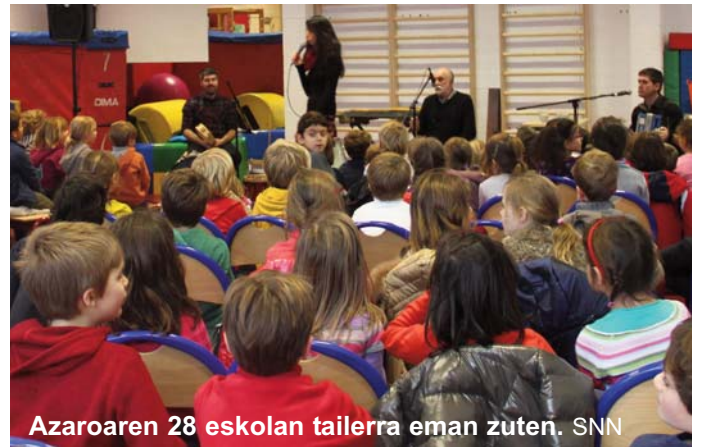
Azaroaren 28 eskolan tailerra eman zuten.