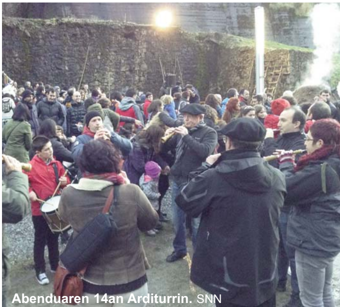
Abenduaren 14an Arditurri. SNN