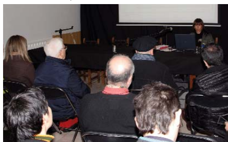
Momento del seminario. SNN