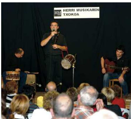
Un momento del concierto que dieron los Arozena.

Por tanto, desde nuestro inicio estaba claro que una de las primeras cuestiones a abordar para fomentar la música popular era organizar eventos en los que se pudieran juntar intérpretes y oyentes, creadores y aficionados. Por eso, tras la inauguración en la primavera de 2002 dimos comienzo a la organización de este apartado.