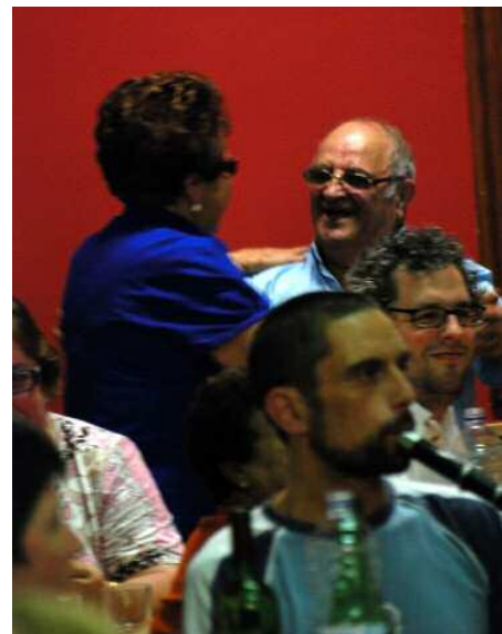
Música y baile después de la cena. SNN