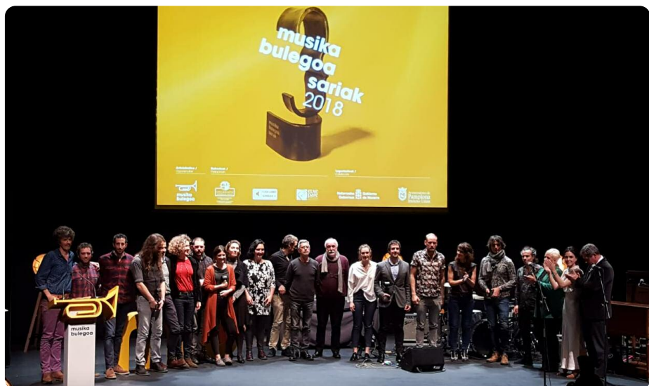
Sarituak, ekitaldiko musikari eta antolatzaileekin. SNN

Soinueneak, bere sorreran Herri Musikaren Txokoa, hasieratik herri musika bizirik dagoen kultur aldaera moduan erakutsi du, inoiz ez kaxa batean aldaezin mantendu beharreko iraganeko oroitzapen moduan. Eta hala, Soinuenea kultura unibertsalaren euskal esparrua besteen ondoan ezagutu eta ezagutarazteko proiektua da. Horregatik jarraitzen du kontzertuekin, tailerrekin, jardunaldiekin, herri musika eskolekin eta argitalpenekin.