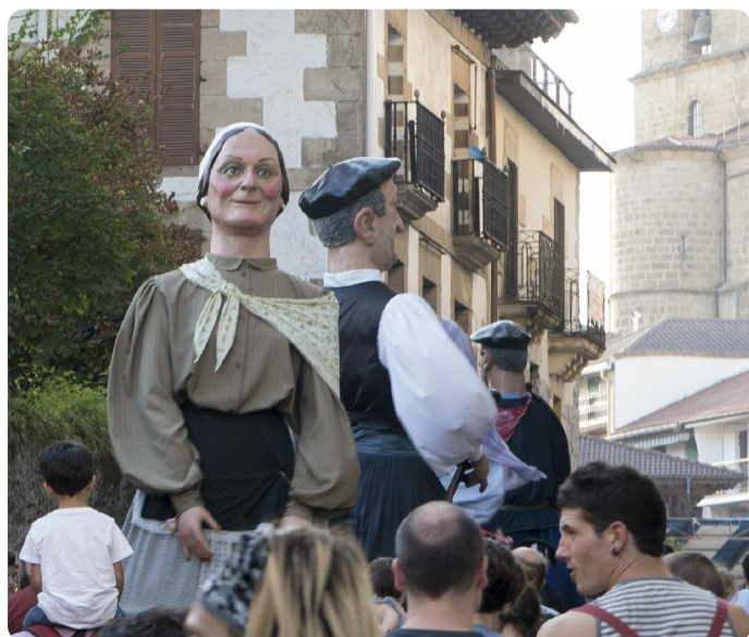
Erraldoiak Xanistebanetan. Oiartzun, 2018-08-02.