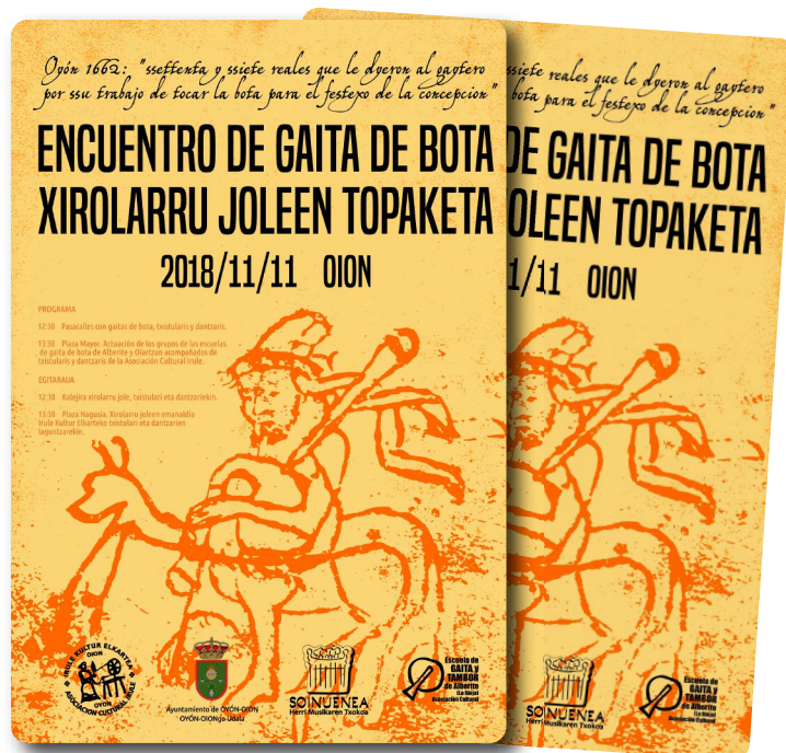
Topaketa iragarri zuen kartela. SNN

Horren ondorioz, Oiongo Irule Kultur Elkarteak Alberiteko Escuela de Gaita y Tambor eta Soinuenearekin azaroaren hamaikan Oionen izan zen Xirolarru Joleen Topaketa antolatu zuen. Xirolarru joleek, txistulari eta dantzariekin batera egin zuten kalejirarekin hasi zuten topaketa eta ondoren herriko Plaza Nagusian xirolarru joleen emanaldia izan zen Irule Kultur Elkartearen txistulari eta dantzarien laguntzarekin.